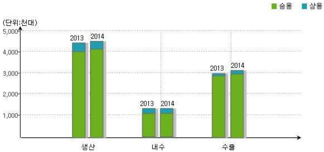
(단위: 천대, %)